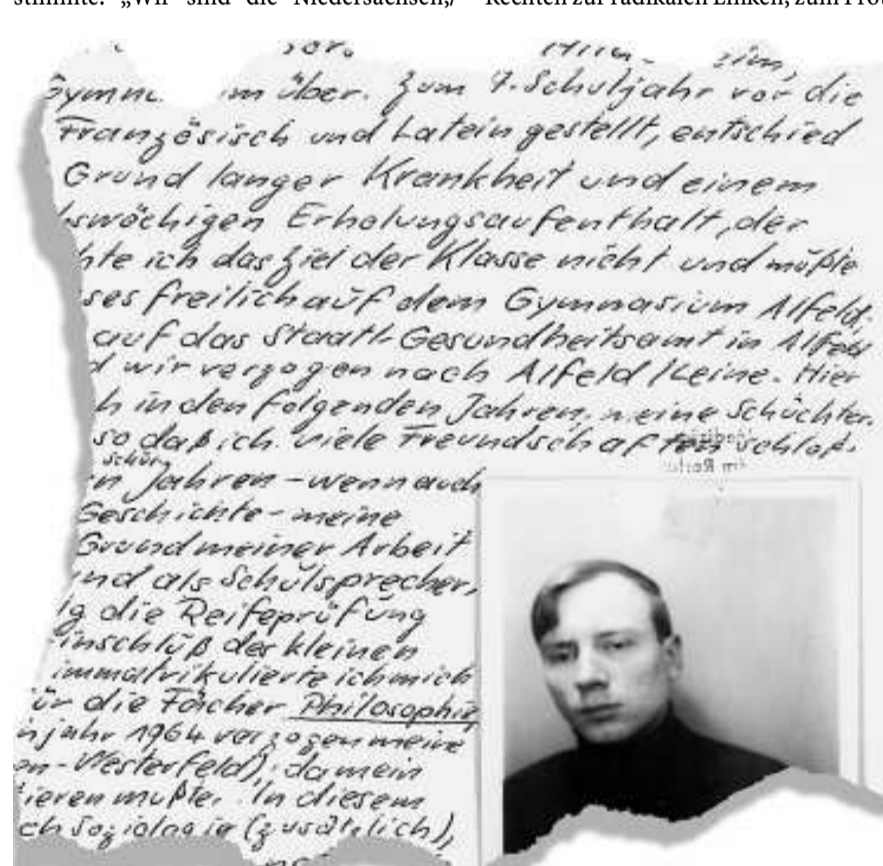
Für die Frankfurter Goethe-Universität verfasst Krahl am 26. Januar 1965 einen ausführlichen Lebenslauf. Es habe sich in den letzten Jahren seine „Schüchternheit immer mehr“ verloren, schreibt der spätere SDS-Tribun, „so daß ich viele Freundschaften schloß“.

Der Siebzehnjährige von 1960/61 dagegen lebte noch ganz in einer vergangenen Epoche, die unter der stillgestellten Nachkriegslandschaft lag. „Jeden Augenblick stießen die Ahnen aus dem Nebel hervor“, wenn er in die neblige Heide ging. Fortsetzung auf der nächsten Seite